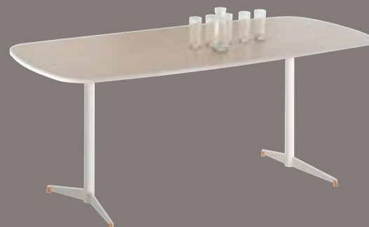
Table 6 personnes*