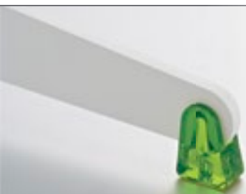
Embout de pied Croix ou "T" 8 finitions au choix, voir page 101.