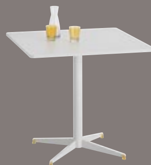
Table 2 personnes*