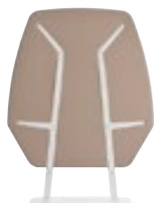
Cloisons, page 20.