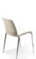
Chaises, page 116.

Différentes hauteurs, dimensions variées, formes, couleurs et finitions.